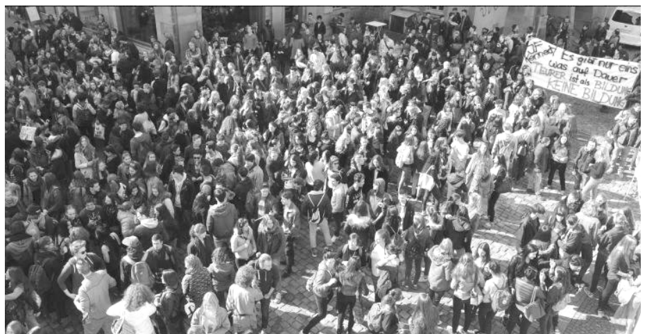
Rathausplatz Bern, 24. März 2015

Als Form des Protests wurde nach mehreren Abklärungen, Diskussionen und Bewilligungsgesuchen, die Platzkundgebung auf dem Rathausplatz gewählt. Es wurden