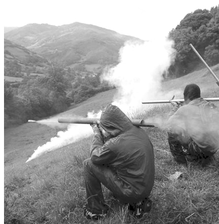
Asturian miners use fireworks to protect their picket lines from an offensive of police forces.

on companies’ benefits or state’s coverage of basic needs is predictable and minimal, this leading to a loss of the strike’s capability for exercising any pressure. Even upon articulation of a long-lasting strike imposing pressure on public and manufacturing sectors, we would still be facing the possibility of offshoring in a globalized economic framework, this generating a vast volume of unemployment. In fact, a global framework forces us into the dilemma „Who’s able to put pressure on whom?“. However, this mobilizations cannot be categorically rejected, exceptional cases illustrate the high strategic value of some lately happened strikes during