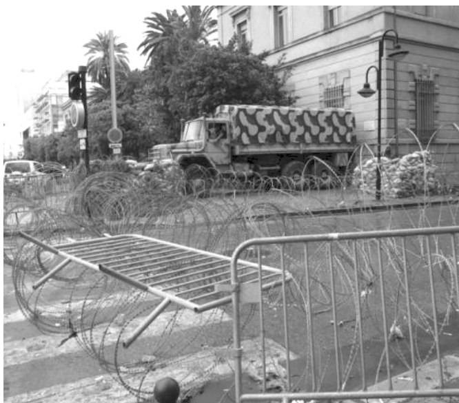
„L'état va récupérer tout“ – Tunis Ende März nach dem Anschlag im Bardo-Museum

Mittlerweile festigt sich die Meinung, dass das System nicht mit den eigenen Waffen zu schlagen sei, da es die Kontrolle über