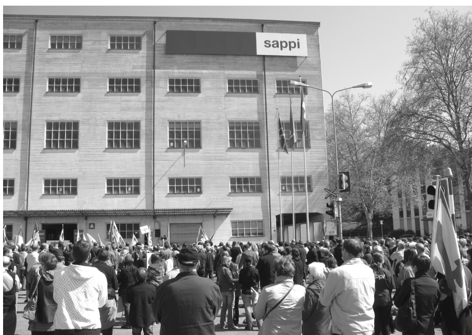
Am Sternmarsch zeigte sich ein grosses Potenzial für Unterstützung aus der Region

beitnehmendenvertretung SPV bewusst. Es wurde deshalb ein Vorschlag für den Weiterbetrieb der Papieri eingereicht, der das von Sappi geforderte Konkurrenzverbot umgeht: Die Umstellung der Produktion von gestrichenem Feinpapier auf Verpackungspapier.