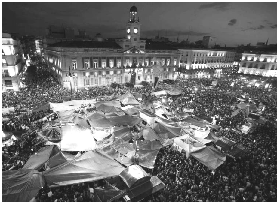
Das Camp bei der Puerta del Sol

Im September 2010 fand ein eintägiger Generalstreik gegen die Arbeitsmarktreformen der Regierung statt. Der Generalstreik selbst konnte die Reformen nicht aufhalten, so dass die ArbeiterInnen das Vertrauen in die Parteien und Mehrheitsgewerkschaften verloren, da sie spürten, dass diese nicht auf das Anliegen der Bevölkerung eingegangen sind. Auf jeden Fall wurde der Streik, in der Industrie und in den linken Städten, so dynamisch und militant geführt, dass er den ausserparlamentarischen Gruppen den nötigen Impuls lieferte, sich mit der Krise und dem sozialen Protest dagegen zu befassen.