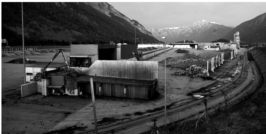
Trostlos und leer ist der ehemalige Arbeitsplatz von 128 Menschen

Leider versandeten die Bemühungen der ESTAK im Frühling dieses Jahres. Deshalb blieb es lange ruhig um die Sägerei in Domat/Ems. Und nun also der Verkauf. Die Sägerei wurde an ein russisches Konsortium verkauft, welches die Sägerei abtut und in Russland neu aufbauen will. Der Erlös von 20 Millionen Franken für den Verkauf und Liquidierung der Sägerei, kommt aber nicht denen zugute, die das Geld brauchen könnten und verdient haben: Da die Erste Österreichische Bank Grundpfand gesicherte Forderungen an die Swiss Timber hat, geht alles Geld an die Bank und die eigentlich bevorzugt zu behandelnden Erstklassforderungen, wie Löhne, machen Zweite.