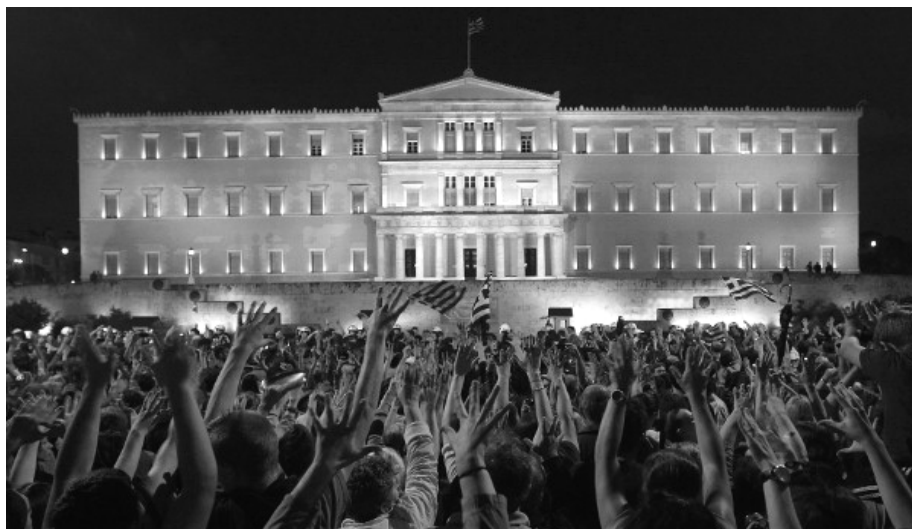
Proteste am 27. Mai auf dem Syntagma-Platz

Bei den nicht aufgehörenden Angriffen auf die Lebensbedingungen scheint es nur ein