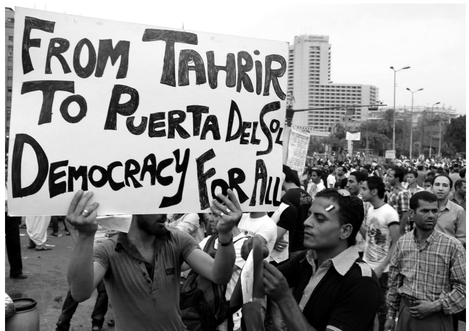
In Ägypten wurde an Demonstrationen direkt auf die Puerta del Sol bezug genommen

Die Medien vermitteln ständig eine Botschaft von Paternalismus und Argwohn. Gegen dies müssen wir ankämpfen, zudem auch gegen alle Fehler die wir ohne