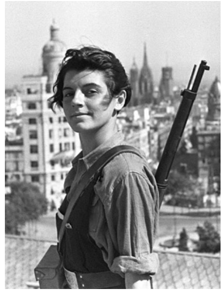
Auch Frauen kämpften für die Revolution - aber nur selten an der Waffe

und England gestärkt, erkämpfen sich immer weitere Teile der Republik zurück. Am 1. April 1939 erklärt General Franco den Bürgerkrieg für beendet. In den folgenden Tagen, Wochen und Jahren unter der Führung des Diktators herrscht eine